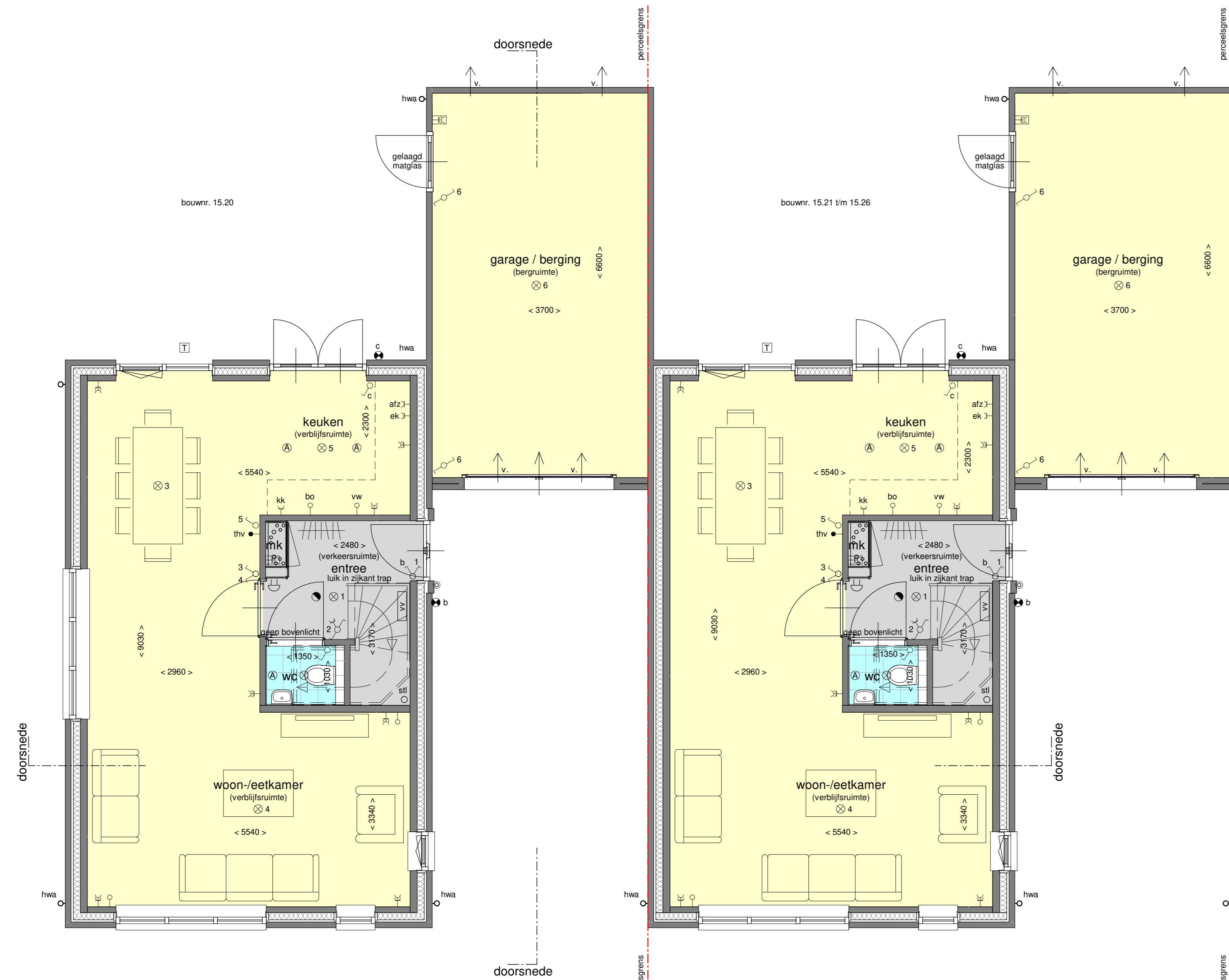
begane grond - 1:50 type R